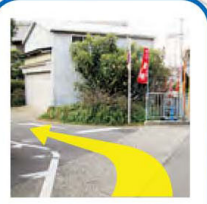
星田公園、星田小学校の前を通って星田駅に向かいます。