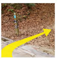
再び山道へ入り、下っていきます。木立の影から差し込む光がやさしいよ。