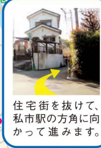
住宅街を抜けて、私市駅の方角に向かって進みます。

大阪公立大学附属 植物園 (私市植物園) 星の里いわふね (交野市立いわふね自然の森 スポーツ・文化センター)