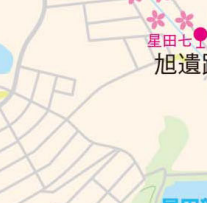
一旦車道に出て歩道を歩くと、ほしだ園地の入口を発見。