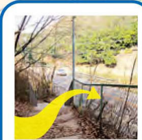
一旦車道に出て歩道を歩くと、ほしだ園地の入口を発見。